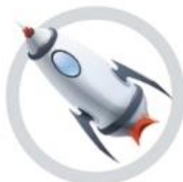
LUFT & RAUMFAHRT